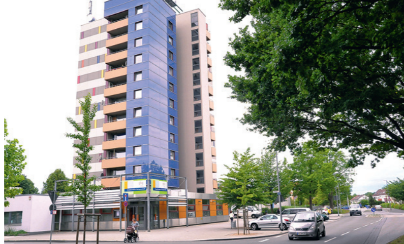
Hoch hinaus in Drispentstedt